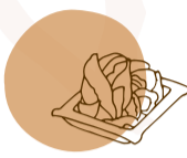
entradas do chef