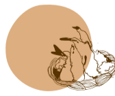
tempuras camarão . legumes queijo creme