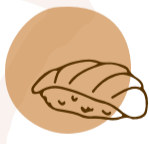
nigiris nigiris braseados com spicy mayo e cebola crocante