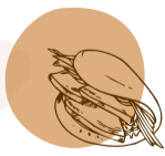
bao pão asiático com barriga de porco a baixa temperatura