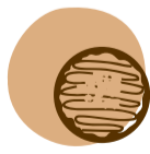
okonomiyaki panqueca tradicional japonesa