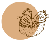
sweet set makis & gunkans fruta . queijo creme compota